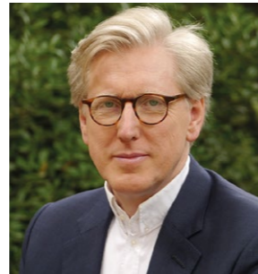
THEO KOLL ZDF-HAUPTSTADTSTUDIO