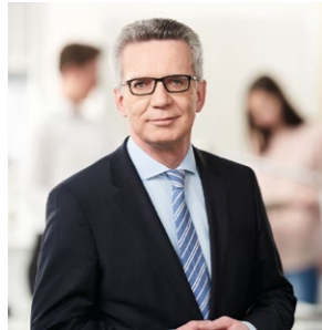
DR. THOMAS DE MAIZIÈRE BUNDESMINISTER A.D.

Freuen Sie sich auf die Beiträge dieser Persönlichkeiten!