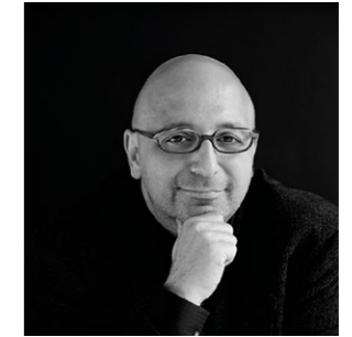
PROF. DR. ARMIN NASSEHI SOZIOLOGE LMU MÜNCHEN MMM-BEIRAT