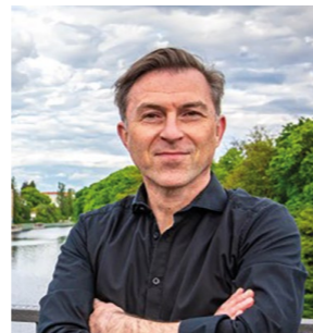
JÖRG REUTER FOOD CAMPUS BERLIN